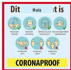
20cm x 20cm